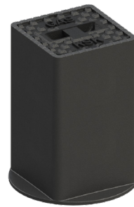
Typ 4059 SGX