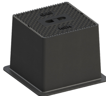
Typ 3582 SGX