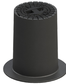
Typ 4056 SGX