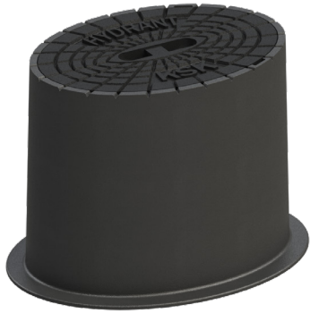
Typ 4055 SGX