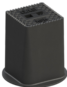
Typ 3581 SGX