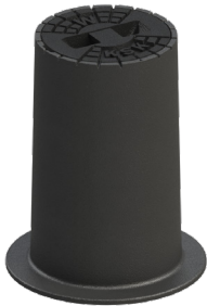
Typ 4057 SGX